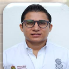
Catedrático Dirección General de Bachillerato del Estado de Veracruz DANTE FERNANDO ARTEAGA RESTREPO