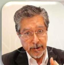
Subsecretario de Promoción y Apoyo a la Industria del Gobierno del Estado de Veracruz RICARDO MANCISIDOR LANDA