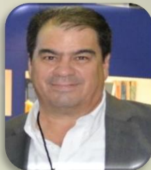
Subsecretario de Desarrollo Económico del Gob. del Edo. de Tamaulipas JESÚS VILLARREAL CANTÚ